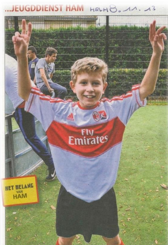
Pop-up Panna Cup trekt van wijk naar wijk met een reizende voetbalkooi

Meerdere doelen werden in korte tijdspanne behaald: gekend worden en toelichten, positieve benadering van de wijk (niet vanuit een probleem vertrekken maar vanuit plaatselijke goodwill), positieve beeldvorming van de doelgroep door persartikels o.m. in het Belang van Limburg en foto's en filmpjes op onze facebookpagina's en YouTube, de stap naar de voorziene dienstverlening verkleinen en het aanbod in de gemeente bekend maken (hier: uitleendienst, spelmateriaal, Kids Café).